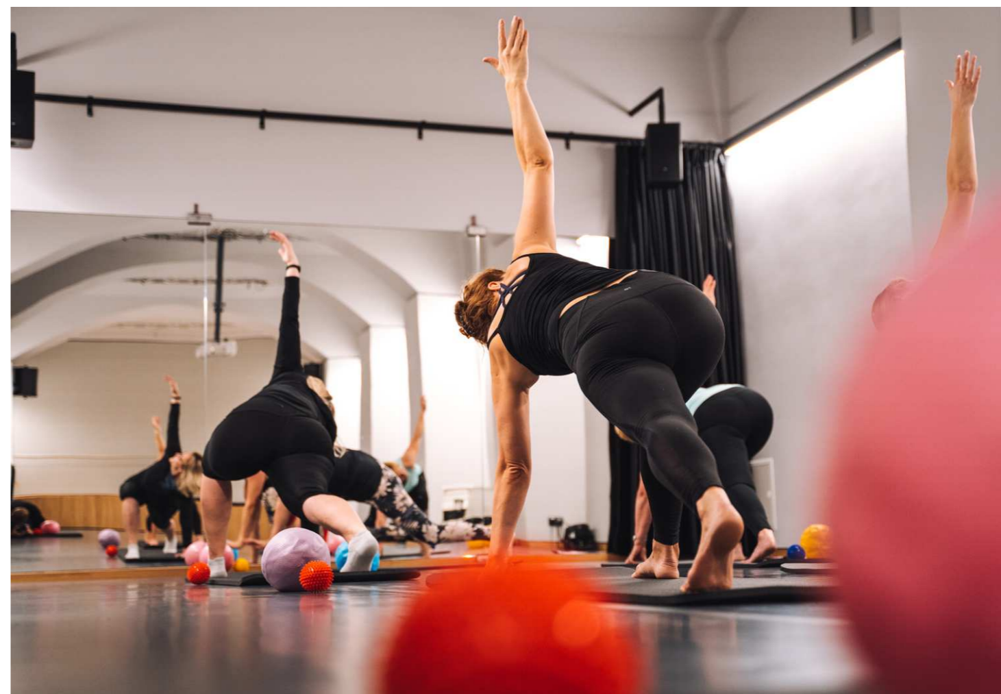
VÝROČNÍ ZPRÁVA 2021 – ANNUAL REPORT 2021